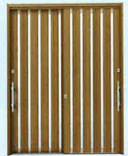
玄関引戸(ペアガラス) 玄関用網戸付