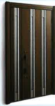
親子ドア (断熱) 手動錠タイプ