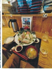
漁師直営の食事処「うらなぎ丸」