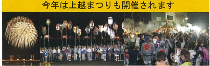
↑上越観光コンベンション協会のHPより