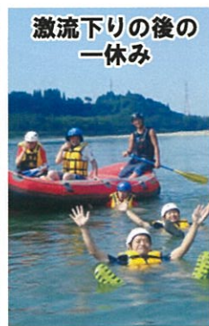
激流下りの後の一休み