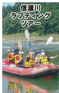
信濃川ラフティングツアー