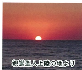
親鸞聖人上陸の地より